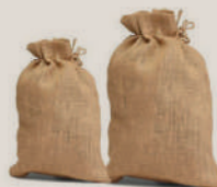
Sacs de 50 kg (dattes sèches)