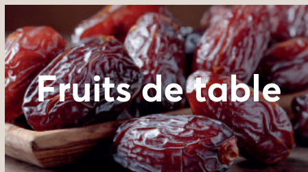
Fruits de table

La plupart du temps, les dattes fraîches (dénouâtées ou non) de la catégorie sélectionnée sont utilisées pour les fruits de table. Cependant, dans de nombreux pays, y compris au Pakistan, les graines des dattes fraîches molles sont chassées manuellement ou à l'aide d'une machine à dénouer et remplacées par des fruits secs comme les amandes, les noix, la pistache, etc., tandis que certains les pressent pour faire des blocs, des barres et des dattes hachées.