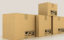
Emballage en masse: (25kg-50kg)