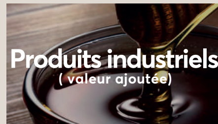
Produits industriels ( valeur ajoutée)

Les dattes séchées (naturelles ou colorées) sont utilisées à la fois à des fins domestiques (pour manger) et industrielles (en poudre). La poudre de dattes sèches est principalement utilisée pour la confiserie, la boulangerie et d'autres produits alimentaires.