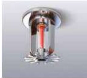
Sistema de rociadores contra incendios