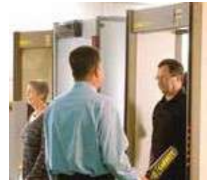
Caminar por las puertas